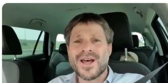
ציוץ את התשובה שלך

נפתלי, די להפיץ ספינים שקריים. אתה יודע מצויין שאין אף סקר בעולם שנותן לנו 6 מנדטים. אתה הרי יודע שאנחנו בין 4 ל-5, שזה גבולי ומסוכן. תפסיק כבר לחבל במאמצים של המחנה הלאומי, הציבור לא יסלח לך אם בגלל השקרים האלה הציונות הדתית תמחק ולימין לא יהיה 61.